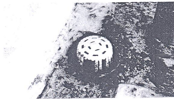
รูปตระแกรงครอบ roof drain ใหม่ทั้งหมด 21 จุด